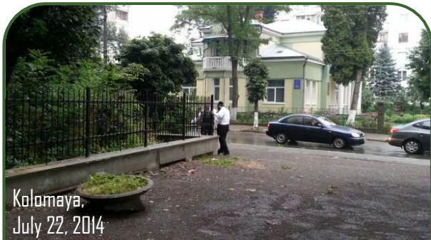
Kalamaya, July 22, 2014