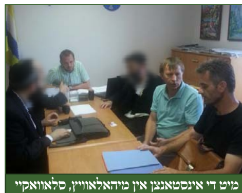
מיט די אינסטאנצן אין מיהאלאוויץ, סלאוואקיי

...ועוד כי רצה להודיענו מקום קבורת האבות באשר האחנו חייבים לכבד מקום קבורת אבותינו ה'ק'. (רמב"ן חיי שרה)