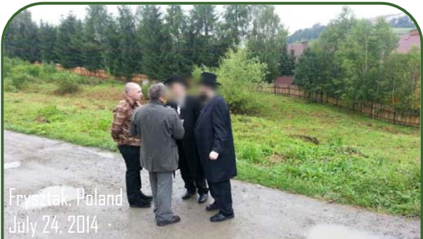
Fryszak, Poland July 24, 2014